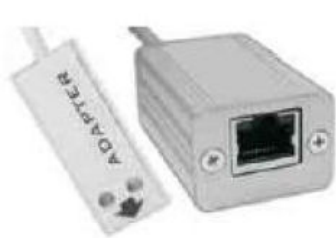
LAN adaptér LP005