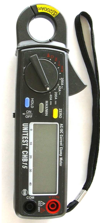
CHB 15 (93468)