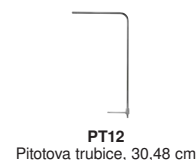
PT12 Pitotova trubice, 30,48 cm